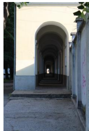
Nagyvárad - a Kanonok-sor