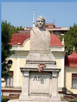
Az Ady Endre Múzeum Nagyváradon