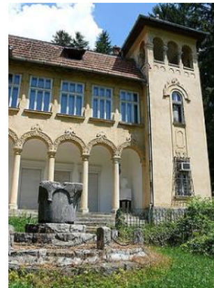
A csucsai kastély nap- inkban