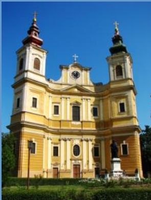
Nagyvárad - Szent László székese gyűház

Telefonszám: 06/99/313-767 Faxszám: 06/99/313-767 E-mail: iskola@eotvos.sopron.hu